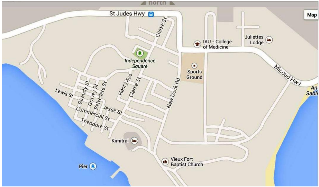
Carte de Vieux-Fort