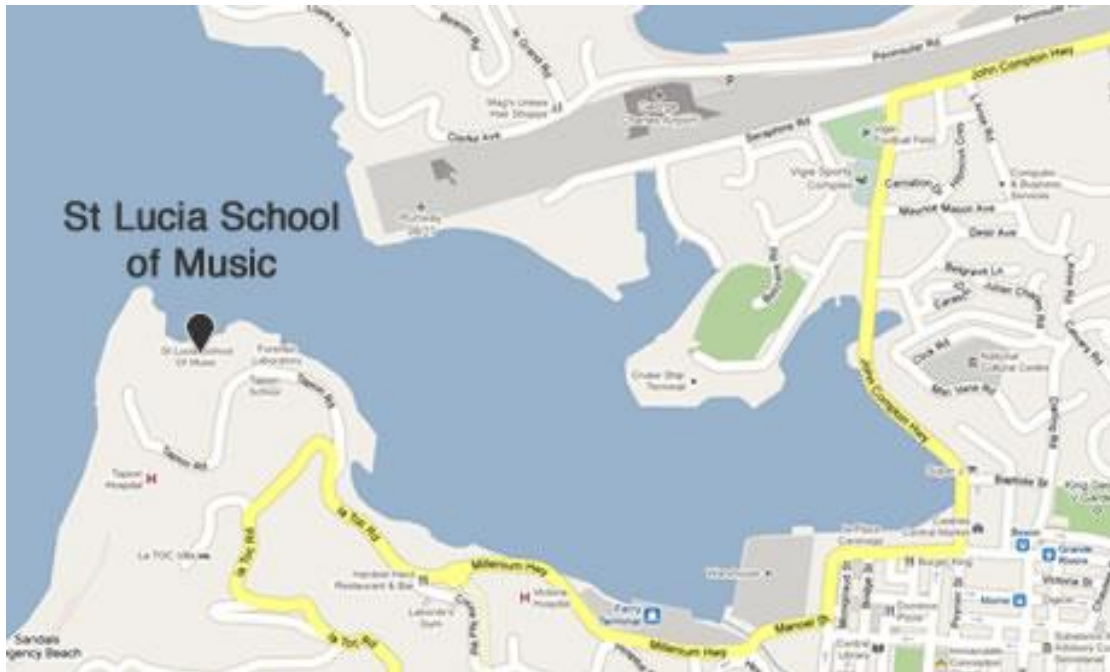
Carte de Castries